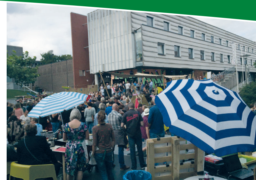
De 'Stadsoase' tussen Coda en Gigant

In de vorige editie van 't Stadsmidden hebben we een oproep gedaan om ons te informeren over bijzondere plekken die u op uw vakantie tegen bent gekomen, met u natuurlijk in de gelegenheid bent geweest om op vakantie te gaan. Plekken waarbij u dacht: "dat zou toch mooi zijn als we dat in Apeldoorn ook zouden hebben." Helaas hebben we tot nu toe pas één inzending gehad. Dat kan een paar dingen betekenen. Het zou zo kunnen zijn dat bij het schrijven van dit artikel nog niet iedereen terug is van vakantie. Een andere verklaring is dat u niets bijzonders bent tegengekomen. Wat ook mogelijk is, is dat u Apeldoorn al zo mooi vindt, dat er niets toe te voegen valt. Maar het kan ook zo zijn dat u de laatste 't Stadsmidden bij de oude kranten hebt gedaan en het e-mailadres kwijt bent. Dan bij deze nogmaals: redactie@wijkraadapeldoorncentrum.nl